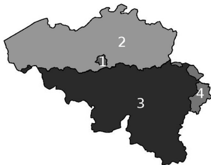
Рис. 1. Разделение Бельгии на лингвистические зоны 5 .

Юридической предпосылкой данной особенности стало законодательное закрепление в 1962 г. языковой границы 4 , разделившей Бельгию (за исключением двуязычного Брюсселя и примыкающих к нему территорий) на три лингвистические зоны: нидерландоязычную, франкоязычную, а также совсем маленькую зону немецкого языка (см. рис. 1).