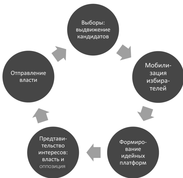
Схема 1. Партии и политический цикл в демократии

объективными причинами сдвигаю в обществах — их системе ценностей, каналам социальной мобилизации и политической культуры.